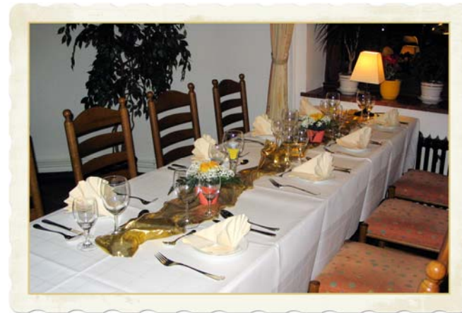
Festlich geschmückter Tisch im Restaurant

Das gemütliche, rustikal eingerichtete Restaurant mit dem modernen Clubraum/Wintergarten bietet eine gutbürgerliche Küche mit gepflegten Getränken und ausgesuchten Weinen.