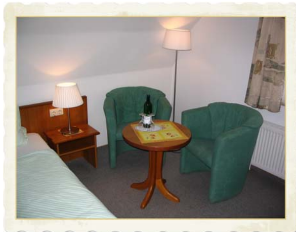
Sitzecke im Gästezimmer

Nach einem reichhaltigen Frühstücksbuffet beginnen Sie entspannt und ausgeruht einen neuen Tag.